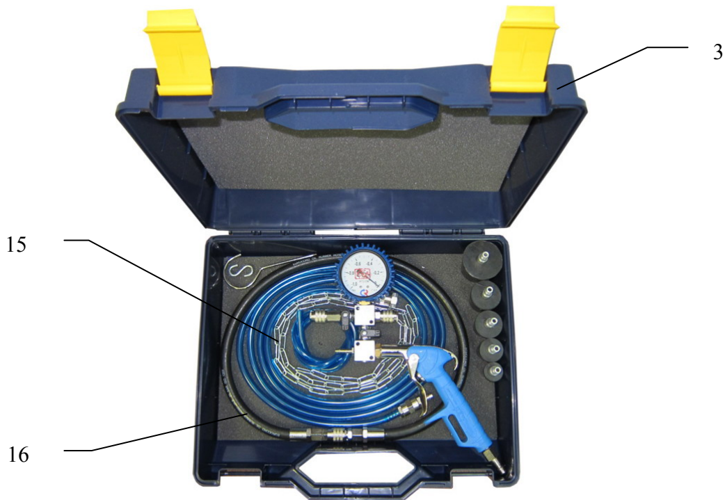
Рис.2 (вид сверху)